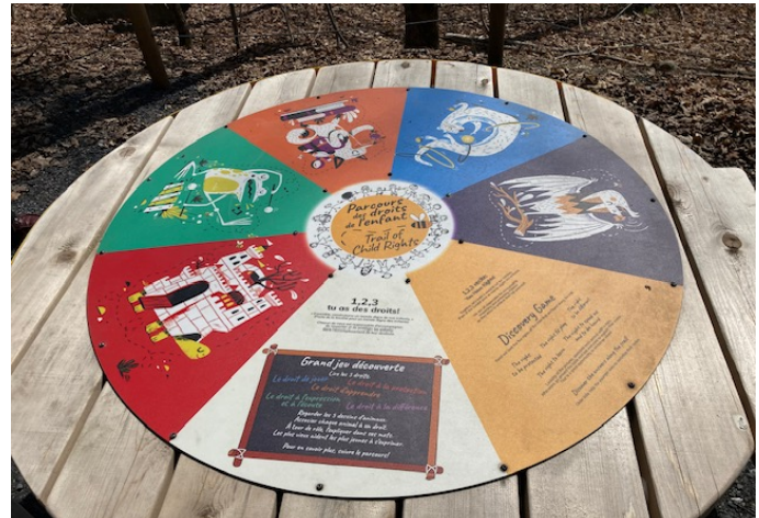
Municipalité d'Austin – Parc Shappie Trough

Il vous est proposé de jalonner le parcours de 6 stations présentant les principaux droits garantis aux enfants par la Convention internationale des droits de l'enfant adopté par l'ONU.