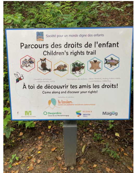
Ville de Magog – Sentier du Lièvre

Un Parcours des droits de l'enfant peut s'installer dans un sentier existant, un parc, dans une bibliothèque ou une aire de jeu. Celui-ci peut d'adapter à tout type d'espace public, pourvu que ce dernier soit accessible et sécuritaire.