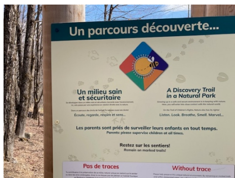
Municipalité d'Austin – Parc Shappie Trough

Le contenu de cette fiche a été développé par : Sylvie Des Roches Adapté par : Espace MUNI