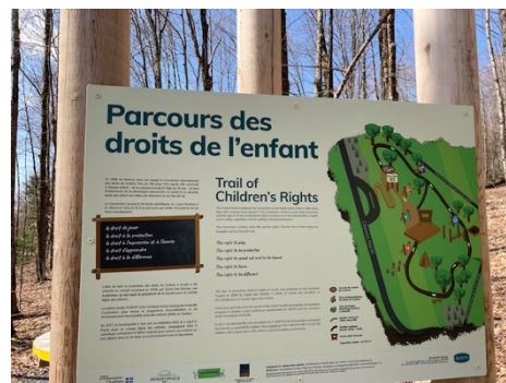
Municipalité d'Austin – Parc Shappie Trough