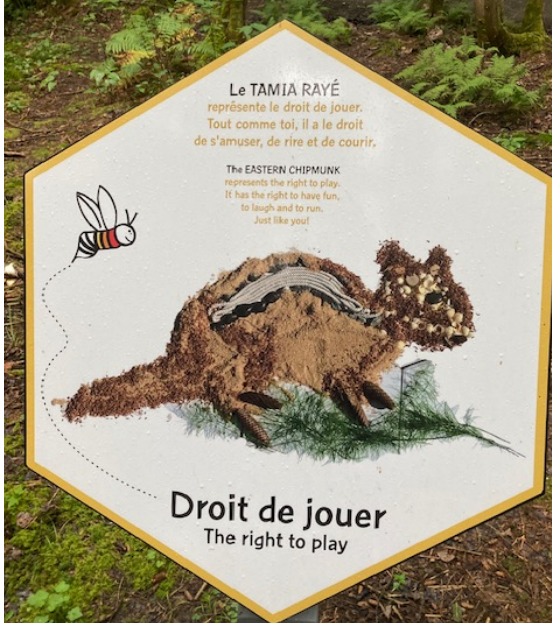
Ville de Magog – Sentier du Lièvre