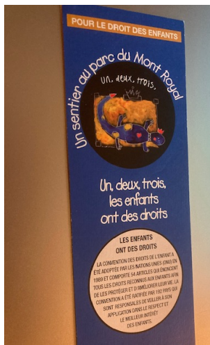
Ville de Montréal - Mont-Royal

Un Parcours des droits de l'enfant s'adresse évidemment aux enfants, mais également à toutes les personnes d'une communauté. Se préoccuper et agir pour le bien-être des enfants est une responsabilité collective!