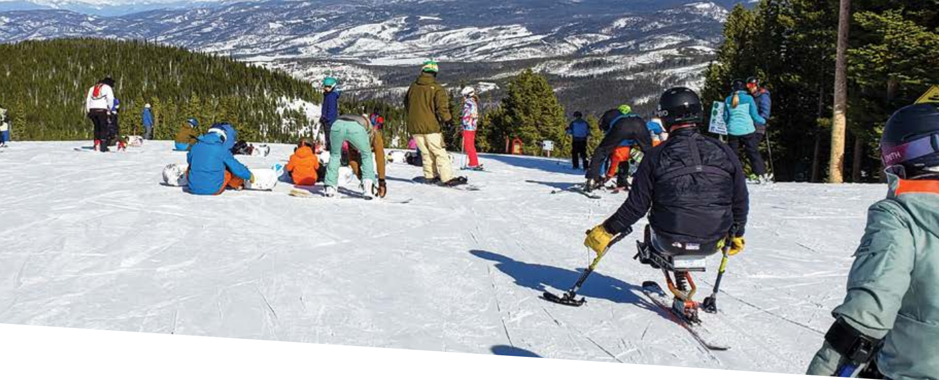
Figure 2. Gamme des possibilités de l'expérience inclusive de loisir